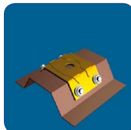
4 Drillnox DBS seitlich befestigen ohne Metallspäne