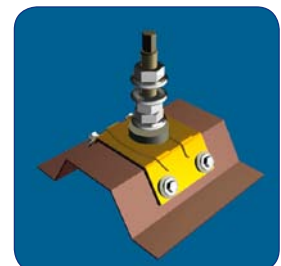
Bauteil mit Sperrzahnmutter befestigen