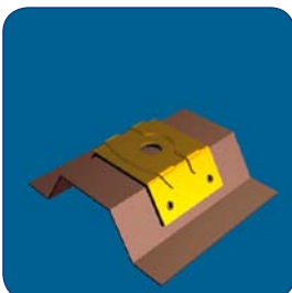
SK PLUS S auf Obergurt positionieren