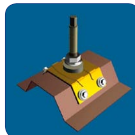
Unterkonstruktion vorbohren und Stockschraube montieren